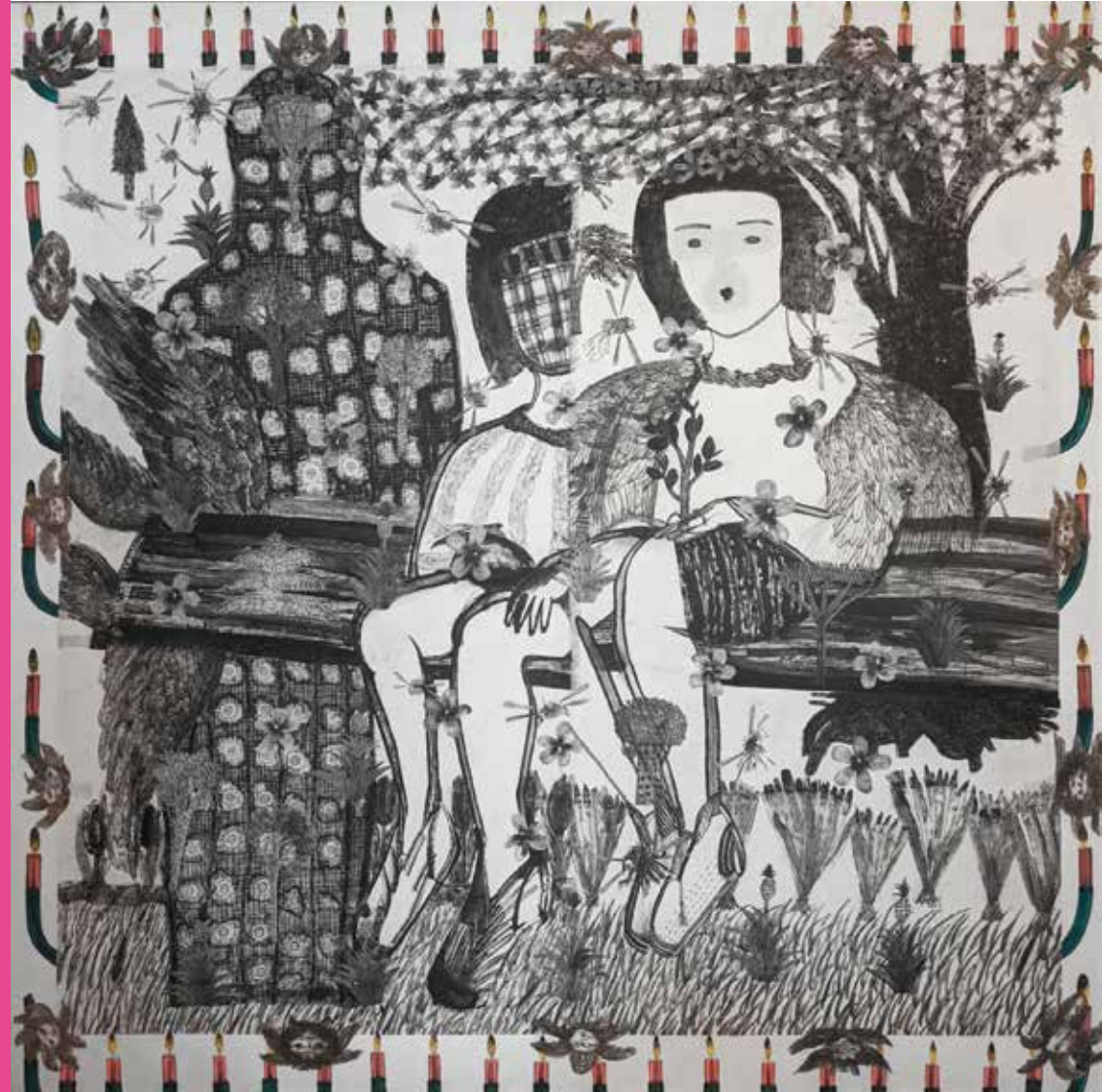
ベンチに腰掛けた少女 2019 和紙に墨、アクリル、コラージュ

2020.4.4~19 at Hasu no hana 中山恵美子「民草絵画展」